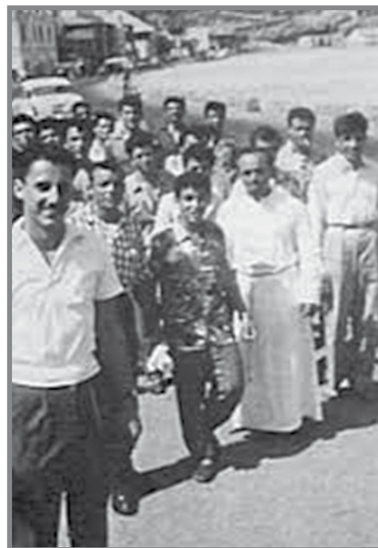
Grupp ta' Maltin li ħelsuha minn fuq l-iSkaubryn f'Aden (illum il-Jemen)

Il-vapur Roma ħa l-passiġġieri Aden (illum il-Jemen) fejn niżlu hemm fl-4 ta' April 1958 li kienet l-Gimgħa l-Kbira. Dawn damu hemm tlett ijiem u ġew trattati sew mill-awtoritajiet lokali. Dawn ġew mogħtija anki xi flus u ġew infurmati l-qraba tal-passiġġieri kemm f'Malta kif ukoll fl-Awstralja. Ta' min jgħid li dawn kienu tilfu kulma kellhom u fosthom kien hemm mara Maltija li kienet sejra tiżzewweġ l-Awstralja u tilfet il-lisba tat-tiegħ fl-istess inċident.