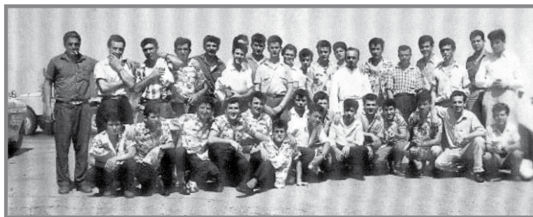
Xi Maltin fosthom Melleħin li salvaw minn fuq l-iSkaubryn

Fortunament fil-qrib kien hemm għaddej il-vapur tal-merkanzija City of Sydney u sar kuntatt mill-SS Skaubryn. Dan mar fejn kien qed jegħreq u gabar il-passiġġieri kollha fuqu. Is-City of Sydney, peress li kien vapur tal-merkanzija, kulma kellu kien akkomodazzjoni għal 30 passiġġier biss. Il-Kaptan ta' dan il-vapur beda jibgħat messaġġi lil vapuri li kienu għaddejjin fil-qrib u fortunament kien għaddej il-vapur lussuz tal-passiġġieri Taljan ir-Roma taħt il-Kaptan Nimira li kien sejjer l-Italja mill-Awstralja li wiegeb għas-sejha tal-ghajnuna u gabar il-passiġġieri kollha tal-iSkaubryn.