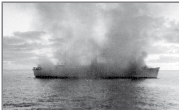
L-iSkaubryn qed jaqbad

Il-vapur ħalla Malta fit-22 ta' Marzu 1958 li kien is-Sibt u wara ftit jiem daħal fl-Oċean Indjan. Fil-lejl tat-Tnejn il-31 ta' Marzu 1958, żviluppa xi ħruq fil-magni tal-vapur li kien ilhom jaħdmu biss sitt snin u n-nar beda jinfirex. Il-Kaptan ordna biex kulhadd jabbanduna l-vapur u tniżzlu d-dgħajjes tas-salvataġġ fejn salva kulhadd minbarra persuna ta' nazzjonalità Ġermaniza li mietet b'attakk tal-qalb.