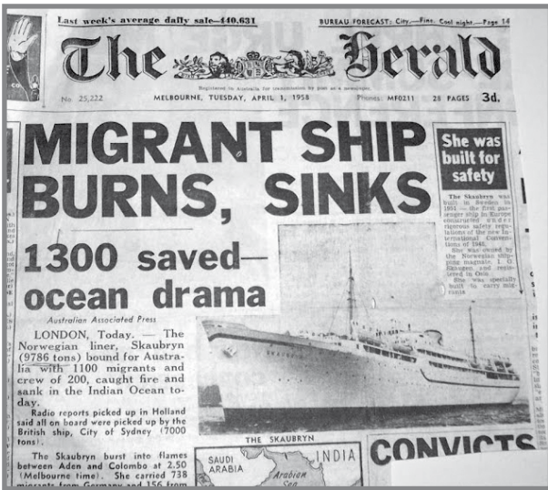
Rapport tat-traġedja f'gazzetta Awstraljana