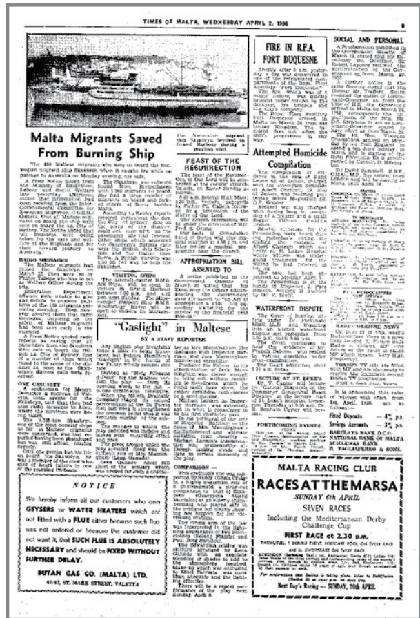
Ir-rapport tat-traġedja tal-iSkaubryn kif irrapportata fit-Times of Malta

Nispera li din il-kitba sservi bħala għarfien ta' grajja pjuttost tragika, bħala parti mill-istorja tal-Mellieħa, fejn persuni Mellehin garrbu n-niket u t-tigrib anki l-bogħod minn xtutna. Minn hawn insellmulhom kemm jekk mietu kif ukoll jekk għadhom magħna f'din id-dinja.